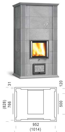
MAMO SOLO 180-2