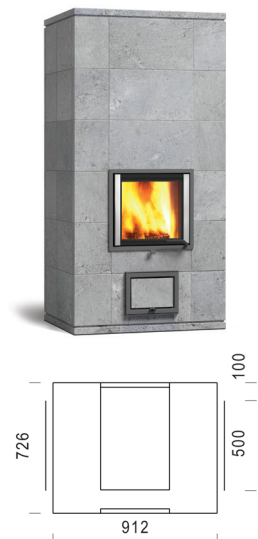
MAMO SOLO 180